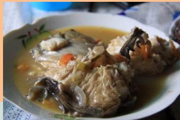
コンゴ川産ナマズのブイヨン