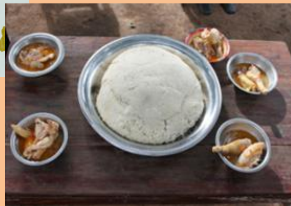
とり肉スープとウガリ